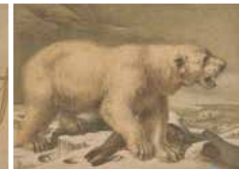
Eisbär. Friedrich Specht. Verlag F. E. Wachsmuth, Leipzig, um 1911