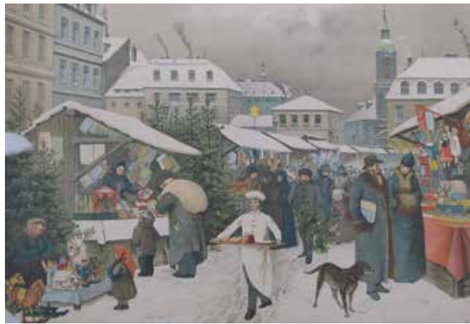
Christmarkt. Hugo Kempfer. Verlag Meinhold & Söhne, Dresden, um 1892