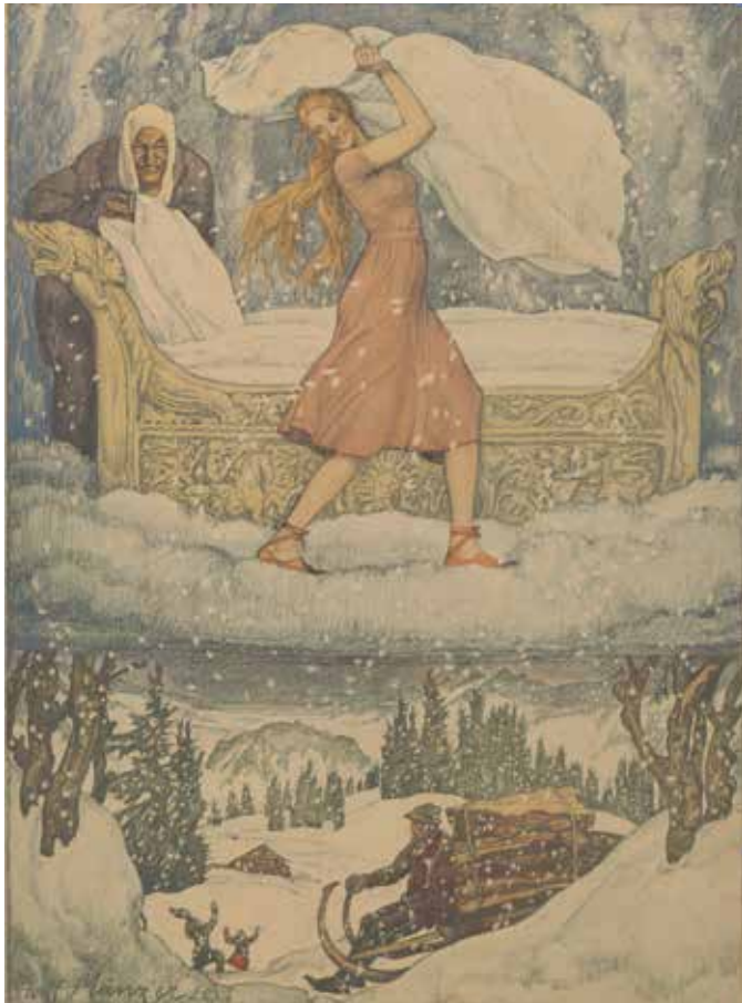
Frau Holle. Adolf Münzer. Verlag F. E. Wachsmuth, Leipzig, 1925

Die gezeigten Schulwandbilder stammen aus der Zeit von 1887 bis 1971. Durch die Zusammenstellung von Bildern zu einer Thematik aus unterschiedlichen Zeiten lassen sich besonders gut gestalterische Veränderungen nachvollziehen und zugleich erstaunliche Gemeinsamkeiten entdecken.