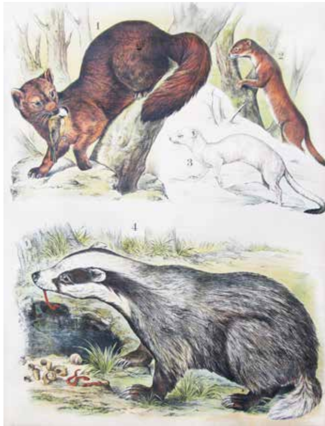
Edelmardeer, Hermelin, Dachs. Franz Engleder. Verlag J. F. Schreiber, Esslingen, 1908