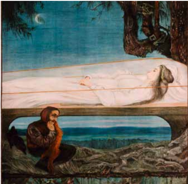
Schneewittchen. Emilie Mediz-Pelikan. Verlag Meinhold, Dresden, 1905