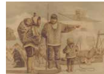
Eskimofamilie. Heinrich Leutemann. Verlag F. E. Wachsmuth, Leipzig, 1887

Das breite Spektrum der in der Ausstellung zu sehenden Bilder verweist auf die verschiedenen Unterrichtsfächer, in denen die Bilder eingesetzt wurden. Für die Biologie waren es die Tier- und Pflanzendarstellungen, im ersten Anschauungsunterricht präsentierte man vor allem Jahreszeitenbilder, sowie Märchen und Fabeln. Im Geographieunterricht wurden landschaftliche Besonderheiten veranschaulicht, und der Deutschunterricht nutzte Bildergeschichten wie den „Wehrhaften Schneemann“ als Schreibanlass. Dabei erhält der Winter jeweils ein eigenes Gesicht – er ist Lebensumfeld, Zeichen für den zyklischen Ablauf des Lebens im Jahreslauf, Ausdruck von Mühsal und Härte ebenso wie von kindlichem Spiel und sportlicher Winterfreude. Die didaktisch aufgebauten Schulwandbilder laden zum genauen Betrachten und Entdecken ein. Gehen Sie spazieren in Winterlandschaften, erfreuen Sie sich an Weihnachten und Wintervergnügen, lassen Sie sich von Märchen mit Winterbezug verzaubern, erfahren Sie, wie Pflanzen und Tiere im Winterschlaf die kalte Jahreszeit verbringen und entdecken Sie das Leben im ewigen Eis!