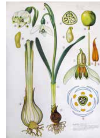
Schneeglöckchen © Hans Pertlwieser. Verlag Dr. te Neues + Co. GmbH, Kempfen, um 1963

Das breite Spektrum der in der Ausstellung zu sehenden Bilder verweist auf die verschiedenen Unterrichtsfächer, in denen die Bilder eingesetzt wurden. Für die Biologie waren es die Tier- und Pflanzendarstellungen, im ersten Anschauungsunterricht präsentierte man vor allem Jahreszeitenbilder, sowie Märchen und Fabeln. Im Geographieunterricht wurden landschaftliche Besonderheiten veranschaulicht, und der Deutschunterricht nutzte Bildergeschichten wie den „Wehrhaften Schneemann“ als Schreibanlass. Dabei erhält der Winter jeweils ein eigenes Gesicht – er ist Lebensumfeld, Zeichen für den zyklischen Ablauf des Lebens im Jahreslauf, Ausdruck von Mühsal und Härte ebenso wie von kindlichem Spiel und sportlicher Winterfreude. Die didaktisch aufgebauten Schulwandbilder laden zum genauen Betrachten und Entdecken ein. Gehen Sie spazieren in Winterlandschaften, erfreuen Sie sich an Weihnachten und Wintervergnügen, lassen Sie sich von Märchen mit Winterbezug verzaubern, erfahren Sie, wie Pflanzen und Tiere im Winterschlaf die kalte Jahreszeit verbringen und entdecken Sie das Leben im ewigen Eis!